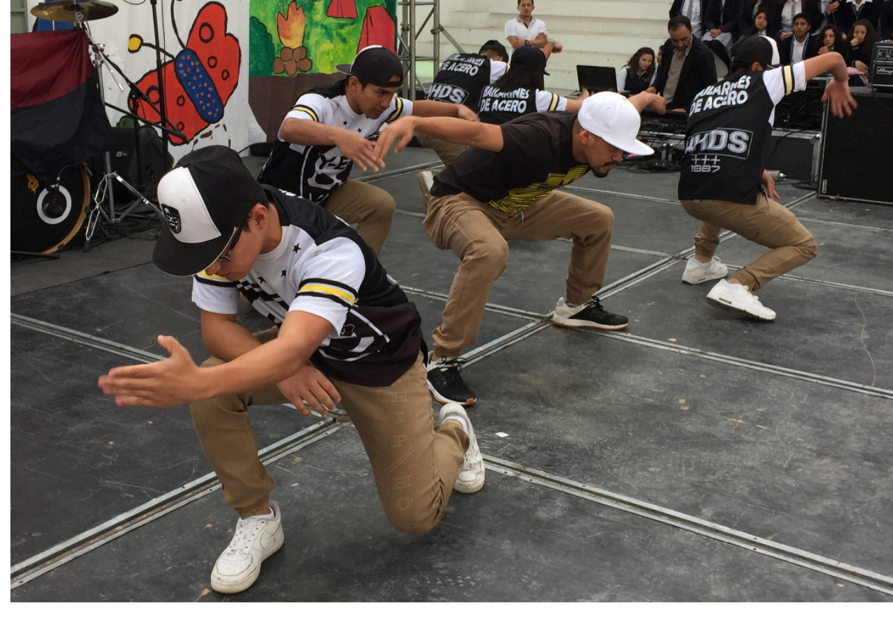
Grupo de Hip Hop de la Casa de la Juventud participó en el evento realizado en Cuenca para la firma del pacto con Niños, Niñas y Adolescentes contra la violencia.

El ejercicio de participación es la mejor expresión de su reconocimiento como sujetos de derechos. Esto implica que sean ellos mismos los actores de la promoción y exigencia de los derechos que les pertenecen como seres humanos. Tiene derecho a expresar sus opiniones en los ámbitos familiar, escolar y comunitario.