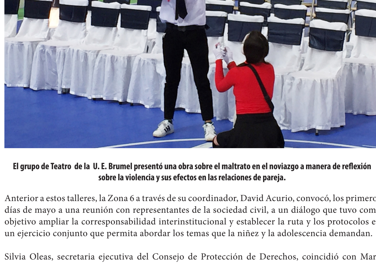
El grupo de Teatro de la U. E. Brumel presentó una obra sobre el maltrato en el noviazgo a manera de reflexión sobre la violencia y sus efectos en las relaciones de pareja.

Es por ello que el Pacto convoca a la sociedad política y a la sociedad civil a resignificar el paradigma de la niñez y la adolescencia promoviendo espacios de participación y libre expresión para su inclusión en condiciones de igualdad con el resto de sujetos sociales. Este Pacto expresa la decisión del Gobierno Nacional para la implementación de políticas públicas con estándares de derechos humanos que transformen sus vidas.