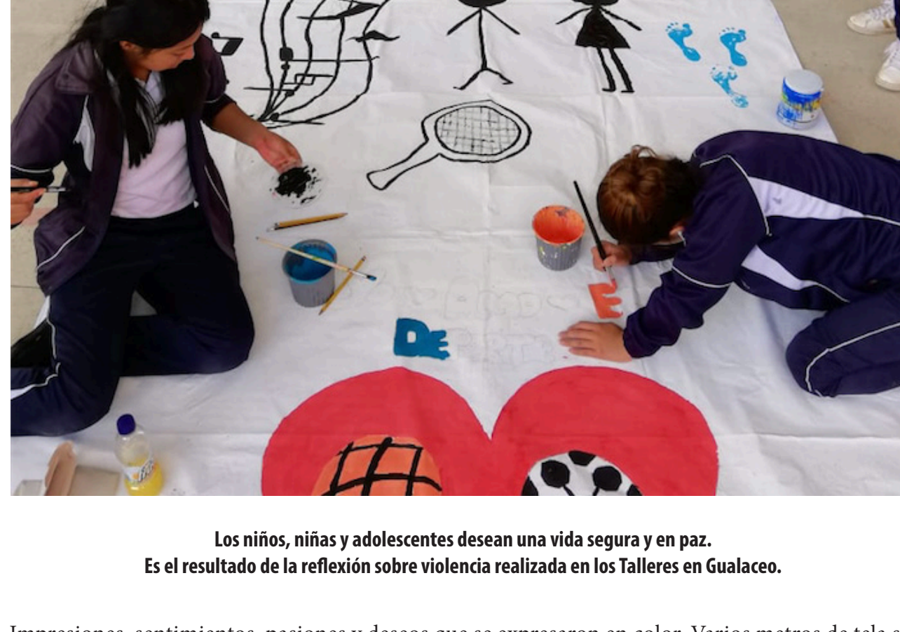
Los niños, niñas y adolescentes desean una vida segura y en paz. Es el resultado de la reflexión sobre violencia realizada en los Talleres en Gualaceo.

Alrededor de 200 niños, niñas y adolescentes hablaron de maltrato, del miedo, del dolor, también de sus preocupaciones y dudas; pero sobretodo de la necesidad de reconocimiento, de ser escuchados y de la aplicación de medidas que los proteja.