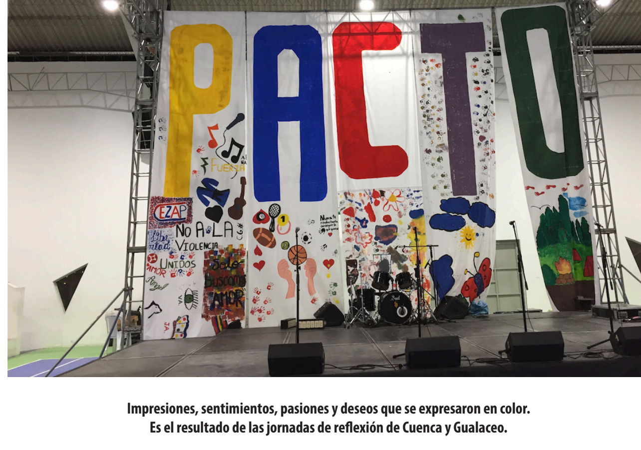
Impresiones, sentimientos, pasiones y deseos que se expresaron en color. Es el resultado de las jornadas de reflexión de Cuenca y Gualaceo.

“El maltrato duele, nos deja cicatrices para toda la vida. No importa si es psicológico, físico o sexual. Siempre dejará huellas en nosotros, no en la piel, pero sí en el alma”, fueron las emotivas palabras de una de las víctimas, hoy refugiada en la fundación María Amor, cuyo nombre se protegió por cuestiones de seguridad.