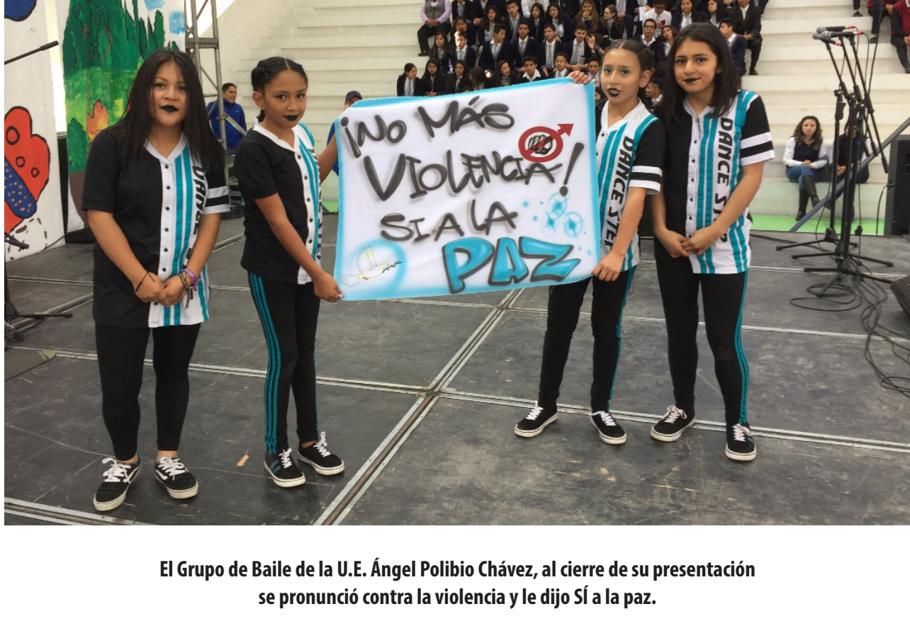
El Grupo de Baile de la U.E. Ángel Polibio Chávez, al cierre de su presentación se pronunció contra la violencia y le dijo Sí a la paz.