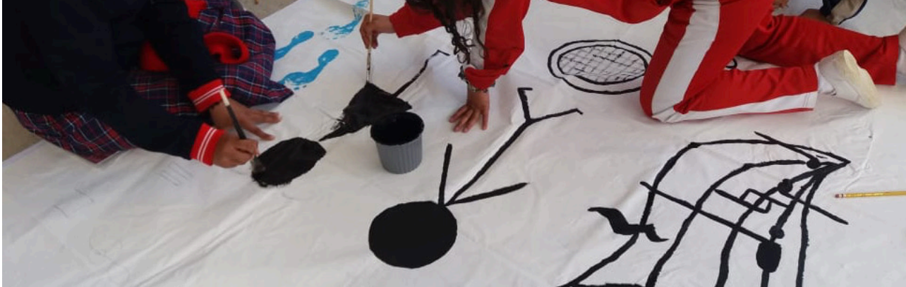
Representantes de los consejos estudiantiles de los colegios de Cuenca plasman sus conclusiones y criterios sobre la violencia.

Ella y su madre de 20 años llegaron hace muy poco a un refugio en la ciudad de Cuenca. Huyeron de la violencia, huyeron del lugar en el que debían estar seguras y protegidas, huyeron de su hogar, huyeron de la persona que en algún momento prometió ser un compañero de vida, prometió ser protector y no un verdugo.