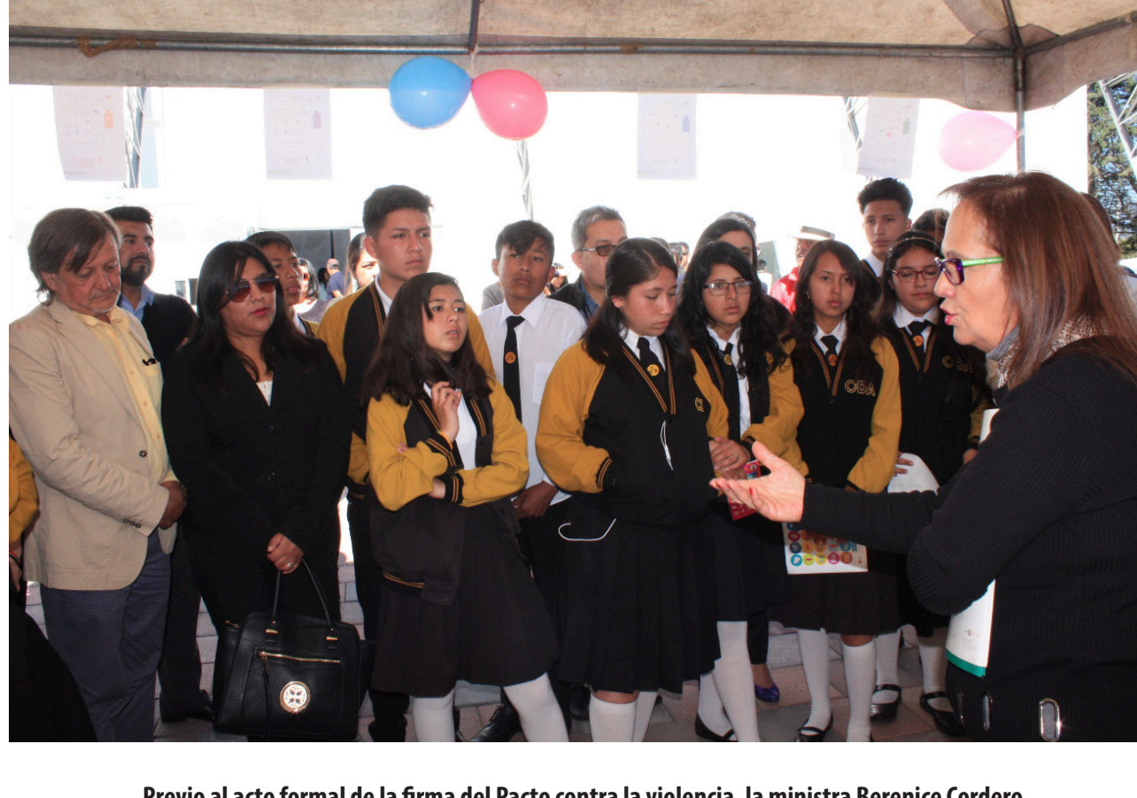
Previo al acto formal de la firma del Pacto contra la violencia, la ministra Berenice Cordero dialoga con estudiantes que participaron en el evento.

En Cuenca, la firma de este compromiso se realizó el 13 de junio. Contó con la participación de cerca de dos mil estudiantes de las escuelas de Cuenca y Gualaceo y juntos compartieron con la ministra de Inclusión Económica y Social (MIES), Berenice Cordero; y junto a ella el compromiso de otras instituciones del Gobierno central y descentralizado, organizaciones sociales y de la sociedad civil.