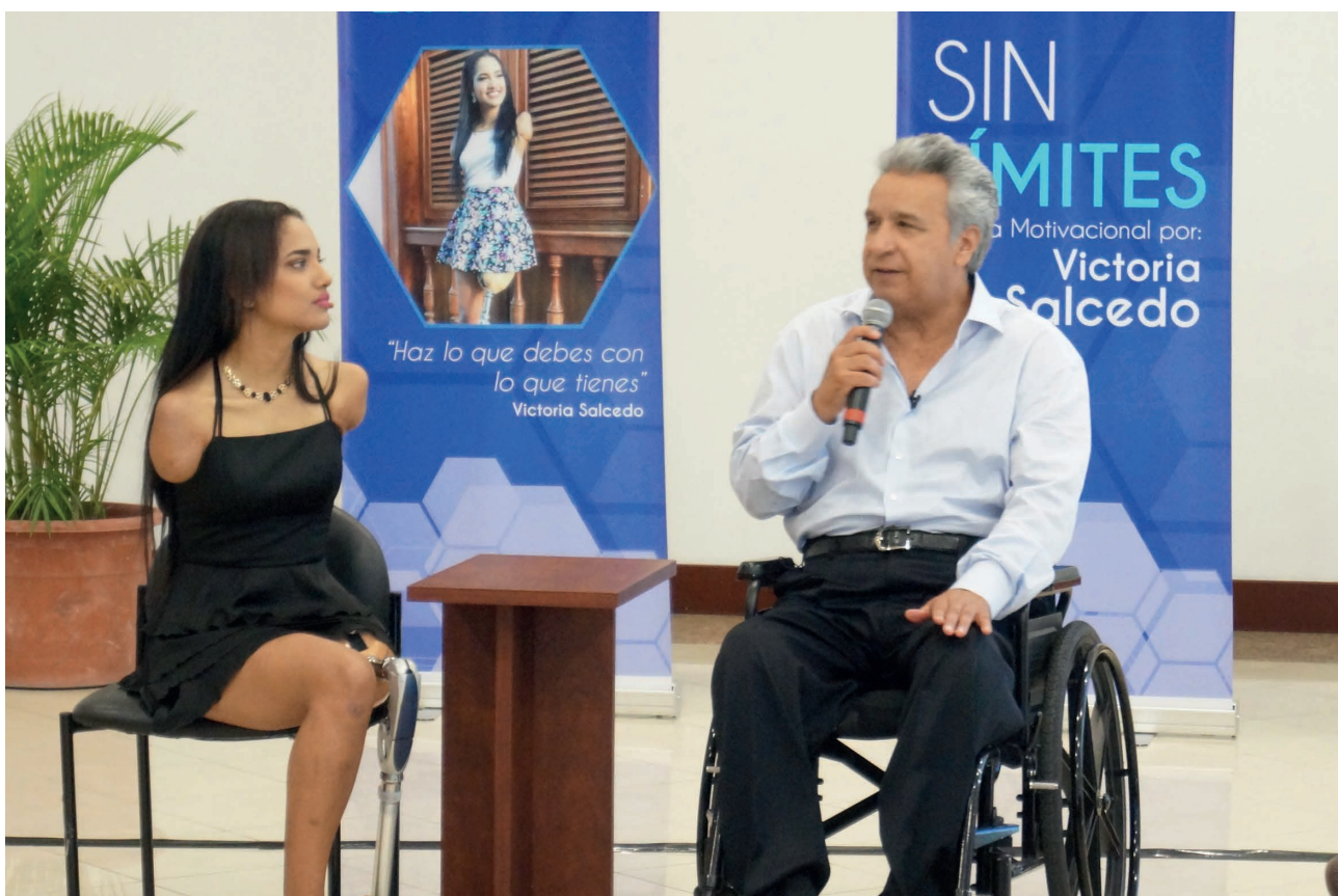
El 13 de agosto de 2018, Victoria junto al Presidente, Lenín Moreno, dictó la charla “Sin límites”.

La idea inició el pasado 13 de agosto de este mismo año, cuando junto al Presidente Lenín Moreno, compartió un espacio aproximado de dos horas, integrando una charla motivacional denominada “Sin Límites”, a la que asistió ella y otras 25 personas con discapacidad que reciben atención del Gobierno Nacional mediante el MIES.